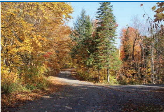
Le premier chemin