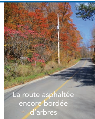
La route asphaltée encore bordée d'arbres