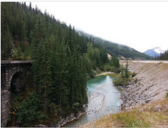
Vue en direction ouest, à partir du bas-côté est. En avant-plan et à gauche de la photo se trouve l'ancien pont. Ce dernier a d'abord été construit pour le transport ferroviaire, puis dans les années 1900, pour le premier réseau routier ( Kicking Horse Road ). Il se trouve aujourd'hui dans les limites du lieu historique national du Col-Kicking Horse et constitue une ressource culturelle d'importance nationale. En contrebas, vue sur la rivière Kicking Horse et en arrière-plan, vue sur Mount Stephen (à gauche) et Mounts Field et Burgess (à droite).

Quant au parc national des Glaciers 3 , le couloir traverse les montagnes emblématiques Selkirk. Elles sont à l'origine d'un système de défense complexe mis en œuvre pour lutter contre les avalanches, d'abord pour la voie de chemin de fer, puis pour la Transcanadienne.