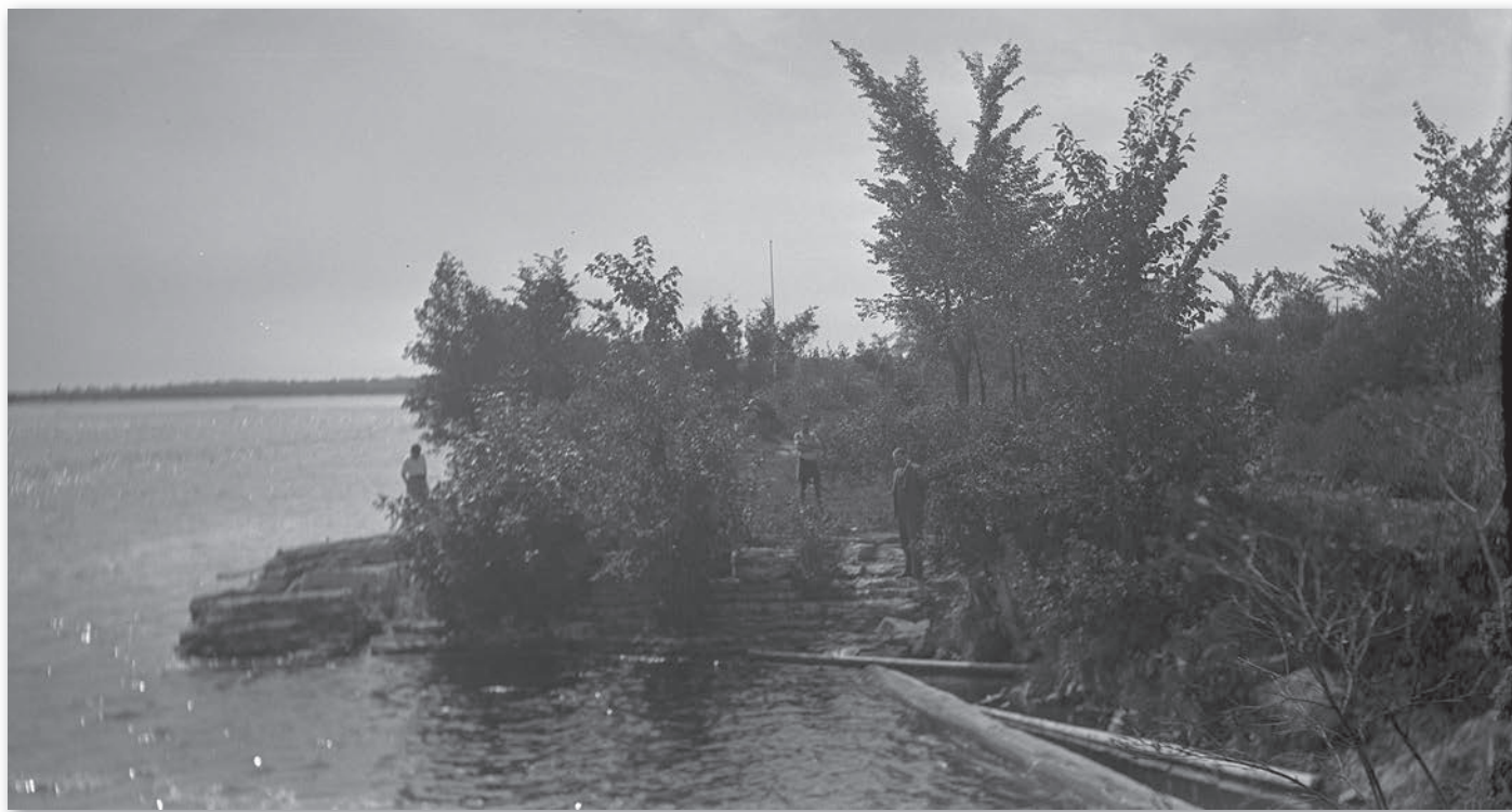
« Foot of Second Portage Le Portage du Milieu of Champlain », 23 août 1932. MKAN 4542785 [Photographe Francis Latchford], Bibliothèque et Archives Canada.

D'autre part, cette interprétation pourrait plus largement interpeller les Gatinois dans leur ensemble de même que les visiteurs . L'histoire derrière le lieu pourrait être présentée de diverses façons pour attirer l'attention du touriste, de l'écolier, du promeneur, du kayakiste, du cycliste.