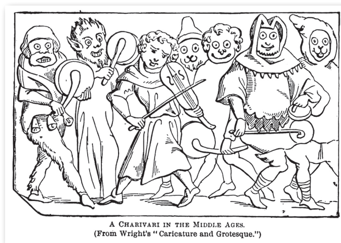
Le Charivari, illustration de Walsh.