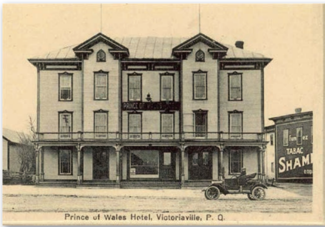
Prince of Wales Hotel, Victoriaville, P. Q.