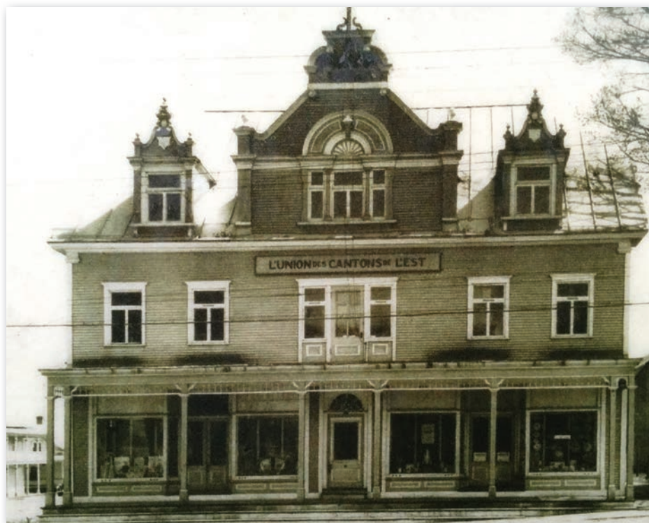
L'édifice de L'Union des Cantons de l'Est en 1926.