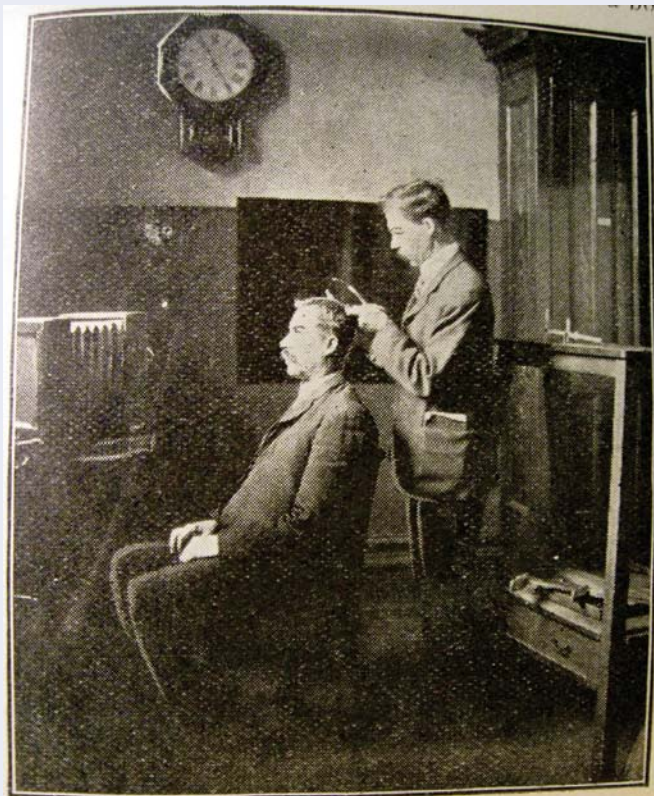
Application du système Bertillon à la Sûreté de Montréal