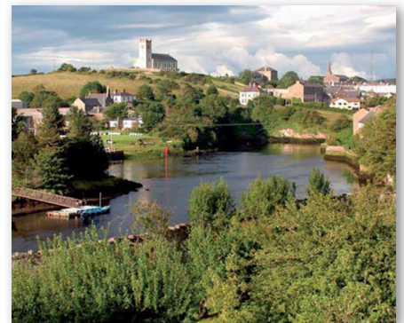
Ballyshannon et le fleuve Erne.