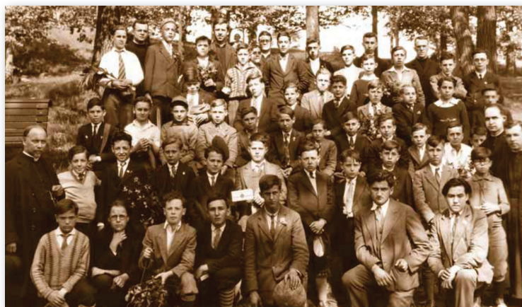
Groupe de jeunes naturalistes ayant pris part à la première excursion générale des CJN au mont Royal, 1931.