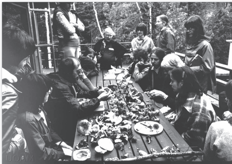
Excursion en mycologie en 1982.