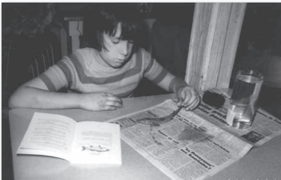
Participant d'une excursion d'ichtyologie à la Station de biologie de Saint-Hippolyte, 29 avril 1972.