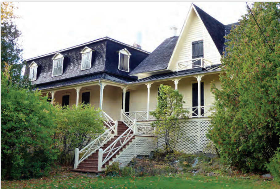
« Les Rochers », résidence sise au 336, rue Fraser, où ont vécu John Alexander Macdonald et sa famille à St. Patrick.

Le Parlement se réunit fin octobre; Macdonald sombre dans le gin et le désespoir et doit démissionner ainsi que son gouvernement, le 5 novembre. Après de longues vacances, tout en assumant ses devoirs de député, Sir John reprend son activité de juriste, partenaire avec son fils, Hugh John. Fin 1875, il rompt leur entente, après une dispute entre eux au sujet des fiançailles du fils avec une jeune veuve torontoise. Leur correspondance révèle un fils raisonnable et gentil et un père autoritaire, revêché et rancunier, mais qui change peu à peu son attitude.