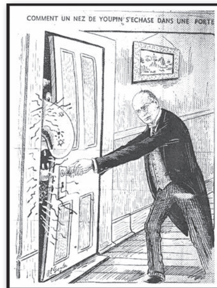
Al Goglu, « Comment un nez de youpin s'échasse dans une porte », caricature parue dans le journal Le Goglu , le 10 mars 1933, p. 6.