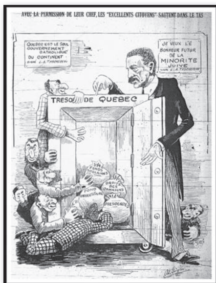
Al Goglu, « Avec la permission de leur chef, les "excellents citoyens" sautent dans le tas », caricature parue dans le journal Le Goglu , le 8 juillet 1932, p.6.