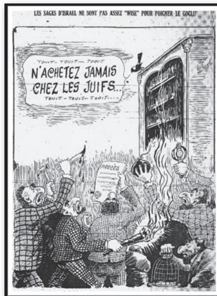
Al Goglu, « Les sages d'Israël ne sont pas assez "wise" pour poigner le Goglu », caricature parue dans le journal Le Goglu , le 29 juillet 1932, p. 6.