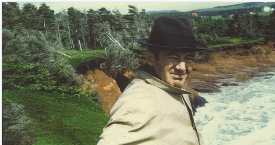
Félix Leclerc en tournée en Gaspésie au début des années 1960.

Par la transmission orale, la chanson folklorique a la particularité de permettre des interprétations multiples, contrairement à la chanson littéraire ou celle transmise par le disque qui offre une version unique. Si la voix demeure l'unique instrument du chanteur traditionnel, la chanson littéraire ou écrite qui se propage dans les années 1930, entre autres par La Bolduc et le mouvement de La Bonne Chanson , se fait maintenant accompagner d'un piano ou d'une guitare.