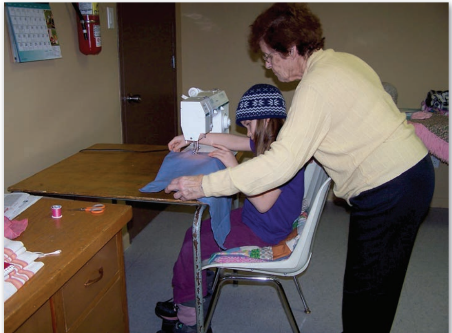
Volet jeunesse, transmission du patrimoine en couture.

Des jardins coopératifs sont créés et entretenus par les membres, la construction de poulaillers est favorisée,