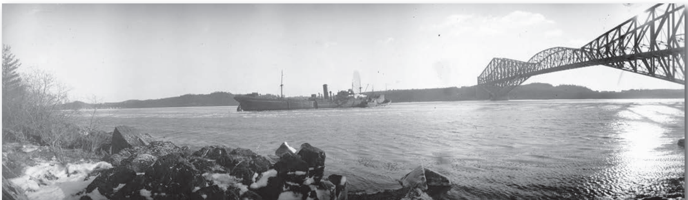
Le Michalis , au lendemain de son échouement, 1941.