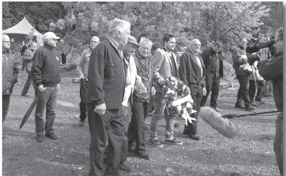
Cérémonie en hommage aux victimes de la drague Manseau 101 au sentier des Grèves, 15 septembre 2012

Les épaves répertoriées par le Service hydrographique du Canada en 2010 correspondent certainement à des naufrages connus. On doit maintenant les associer aux épaves. Le portrait des fonds marins se dessine tranquillement à