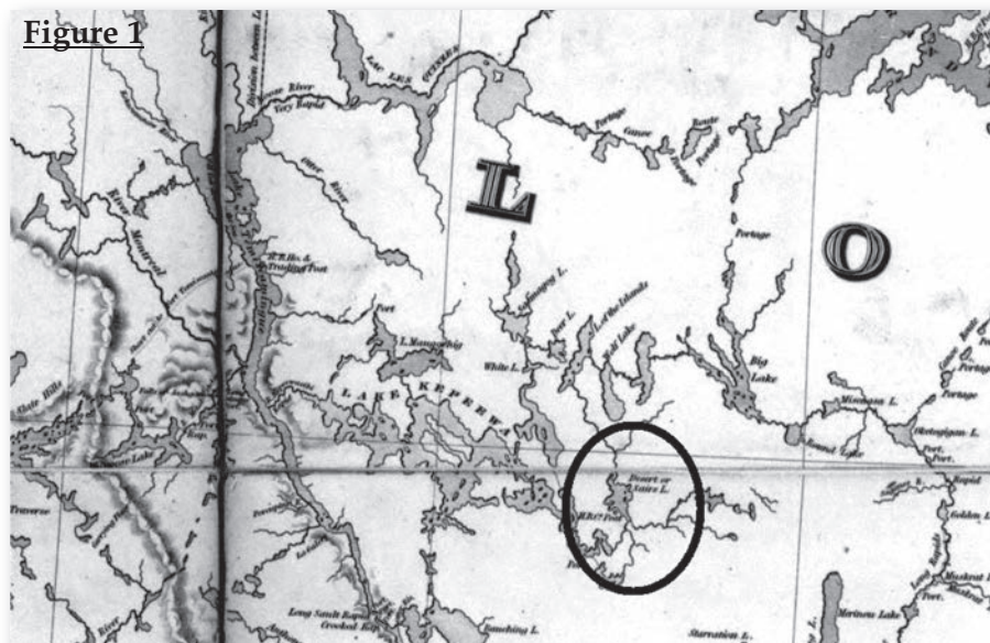
Détail de la carte de Bouchette, montrant l'emplacement du Desert's Post. Nous avons encadré l'endroit en question

Les années présentées ici sont les seules conservées dans les archives. Les décisions prises lors de ces conseils étaient sensées s'appliquer pour la saison à venir. Par exemple, l'information donnée pour 1839 s'appliquait (normalement) pour la saison de traite de 1839-40. Étant donné que le poste portait déjà le nom à Desert à l'été 1839, on peut supposer qu'il fut établi un peu avant la tenue de ce conseil, probablement en 1838. Nous savons qu'il fut fermé en 1847, lors de l'ouverture d'un nouveau poste, Hunter's Lodge, qui venait remplacer le poste à Desert ainsi que celui d'Opemica 11 . Fait significatif : Louis Desert quitte son emploi au même moment 12 .