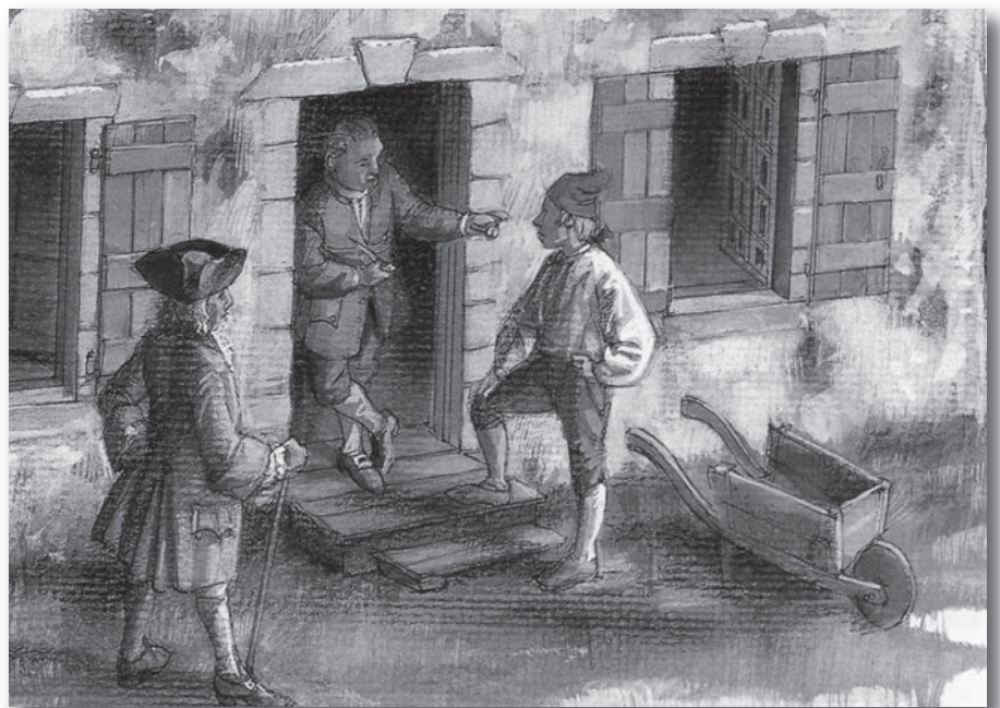
Trois Montréalais (détail) (Crédit : Illustration : Francis Back©)

On dit également des Canadiens qu'ils sont très pieux. C'est en tout cas ce qui ressort du témoignage de Kalm, mais il est loin d'être le seul à avoir relevé ce trait, car de fait, l'encadrement religieux est rigoureux et assez strict dans les petites villes coloniales. En revanche, les doléances nombreuses des curés et la foison des délits inscrits dans les archives judiciaires (65% des accusations sont enregistrées à Montréal) nous rappellent qu'une certaine propension à l'insubordination et à la « dissipation des moeurs » caractérise la population montréalaise, phénomène qui,