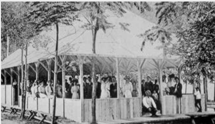
Pavillon de danse à Coney island, près de Windsor (vers 1905) Les lieux de loisirs et de plaisirs se multiplient au début du XX e siècle, malgré les mises en garde répétées du clergé catholique.

Les Américains sont les fils des Révolutionnaires de 1776. Ils sont le premier peuple colonisé à avoir arraché par les armes leur indépendance. Ils privilégient la démocratie locale, de proximité, par laquelle les individus libres et propriétaires consentent à se taxer pour se doter de routes ou d'écoles. Ils ont un sens de la liberté individuelle, de l'initiative et se méfient de l'étatisme.