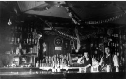
Le bar de l'hôtel du Canadien Pacifique à Lac-Mégantic vers 1900 est bien fourni! Le clivage entre Canadiens français et Anglo-protestants au Conseil municipal des villages de Mégantic et d'Agnès fera se succéder en peu d'années périodes de prohibition totale et systèmes de licences.

Leur sentiment religieux est plus à l'aise dans les églises évangéliques, les sectes ou les dissidences.