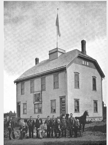
Dans certains villages anglophones des Cantons-de-l'Est, le sentiment anti-catholique et anti-français se développe à la fin du XIX e siècle, favorisant l'organisation de loges orangistes. Officiers de la loge Lord Erne Loyal Orange et leur lieu de réunion à Waterville en 1896.

La tension culturelle la plus ancienne dans la région fut le clivage entre d'une part, les Loyalistes et les Britanniques immigrés et, d'autre part, les Américains d'esprit républicain,