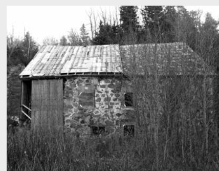
Moulin Robert-Lagacé ou moulin du Petit-Sault.