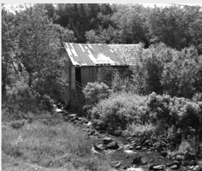
Moulin Robert-Lagacé ou moulin du Petit-Sault.

historique. Dès lors, la propriétaire envisage de vendre sa propriété. Le ministère n'a pas l'intention de se prévaloir de son droit de préemption (article 22) lui permettant d'acquérir le bien de préférence à tout autre acheteur. Toutefois, malgré de nombreuses offres, la propriétaire refuse toujours de vendre et même d'entretenir sa propriété.