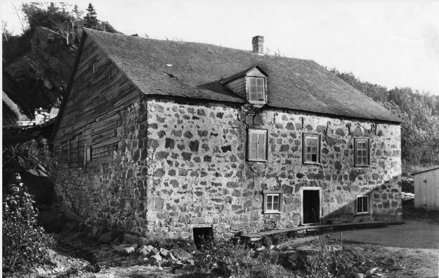
Moulin de l'Isle-Verte, 1925.