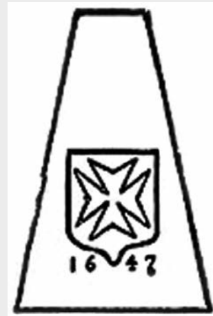
La pierre du premier château Saint-Louis.

La comparaison de l'illustration de Gagnon avec la photo prise récemment par l'auteur du présent article laisse voir de façon très évidente qu'il manque la partie inférieure de la pierre, celle mentionnant le millésime. Le texte de la plaque de bronze fixée à la porte cochère aujourd'hui ne fait cependant aucun doute sur l'origine de la petite sculpture. On y lit en effet qu' au-dessus de cette porte cochère se trouve la pierre de la croix de Malte. En 1647, Charles Huault de Montmagny, chevalier de l'ordre de Malte, premier gouverneur et lieutenant général de la Nouvelle-France la fait placer sur le château Saint-Louis.