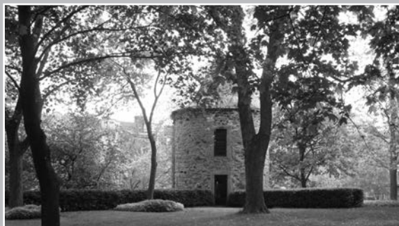
La tourelle du Grand Séminaire des Sulpiciens, à Montréal. C'était là l'une des six excursions proposées aux congressistes le 22 mai dernier.

le Gouvernement de l'Ontario et l'Office des affaires francophones de l'Ontario, le Regroupement des organismes en patrimoine franco-ontarien, la Société nationale de l'Acadie (SNA), la Fédération des familles souches du Québec (FFSQ), le Centre de recherche en civilisation canadienne-française de l'Université d'Ottawa, le Centre de la francophonie des Amériques et la Fédération des associations de familles acadiennes. Quelque 350 personnes ont participé au Congrès, ce qui constitue une première pour ces organismes et une démarche audacieuse, sinon prometteuse, pour la francophonie en Amérique.