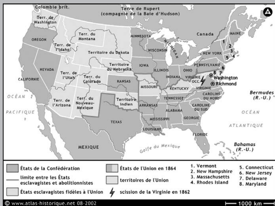
Carte des États-Unis à l'époque de la guerre de Sécession

La principale difficulté résidait dans la rareté de sources permettant d'aborder de manière originale un phénomène dont les participants ont laissé peu de traces. Après une nécessaire relecture des études réalisées jusqu'ici sur le phénomène et une analyse du contenu de journaux de l'époque afin de nous familiariser avec le climat socio-économique et politique, nous avons dépouillé plus de 1 300 dossiers militaires de soldats d'origine canadienne-française enrôlés dans les armées du Nord, renseignements conservés aux Archives Nationales à Washington (N.A.R.A.). L'analyse du contenu de ces dossiers, inexploités jusque-là, a permis de définir le profil de ces combattants, d'évaluer leur importance numérique et de préciser leur parcours. Nous nous en sommes inspirés pour pénétrer dans leur