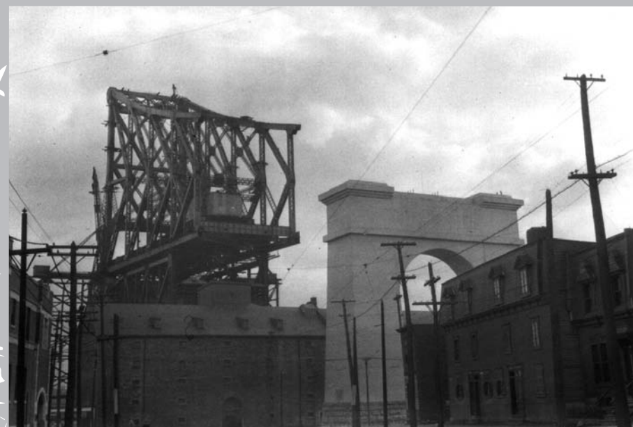
La construction du pont entraîne de nombreuses démolitions dans le quartier Sainte-Marie.

La région entourant Montréal se développe elle aussi et la ville se retrouve au centre d'un marché en pleine croissance. Les petits commerçants des villages environnants visitent régulièrement les grands magasins-entrepôts afin de trouver les marchandises qu'ils pourront écouler dans leur localité. Les cultivateurs s'y rendent aussi pour