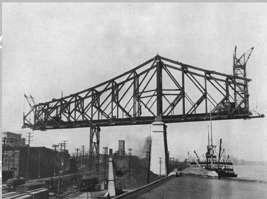
Construction en cantilever, pilier n° 25 dans le port, en 1928.

Pendant cette même période – 1910-1920 –, le port de Montréal connaît aussi une croissance extraordinaire. Même s'il est fermé à la navigation quelques mois par année, il demeure le deuxième port en importance en Amérique du Nord, juste après New York. Des hommes d'affaires influents évoquent la possibilité d'étendre les activités du port à la rive sud. La construction d'un nouveau pont, qui permettrait de faciliter le transport des marchandises d'une rive à l'autre, devient de plus en plus une priorité. Il y a cependant une contrainte incontournable : la navigation et les activités du port ne doivent pas être perturbées par la mise en marche de ce nouveau chantier.