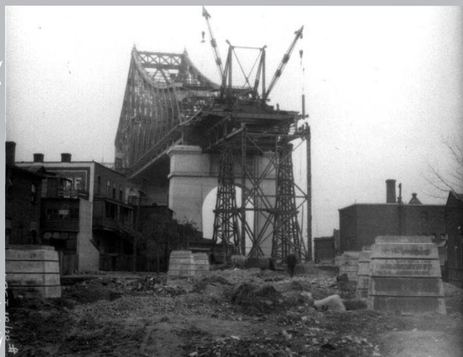
La construction du pont ouvre une brèche dans le tissu urbain.

Plus tard, en 1880, c'est la proposition Schearer qui retient l'attention. Chaque printemps, le port de Montréal est exposé aux crues printanières et, afin de protéger les installations portuaires contre les glaces, les autorités élaborent le projet d'une digue s'avancant dans le fleuve, à partir de laquelle un pont serait construit et traverserait le fleuve jusqu'à Longueuil en prenant appui sur la partie ouest de l'île Sainte-Hélène. Seule la digue sera construite.