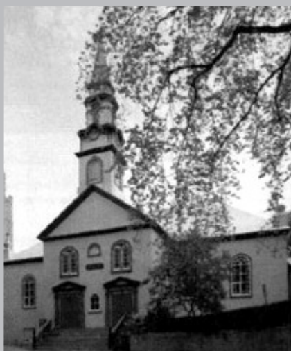
Église St. Andrew, Québec.