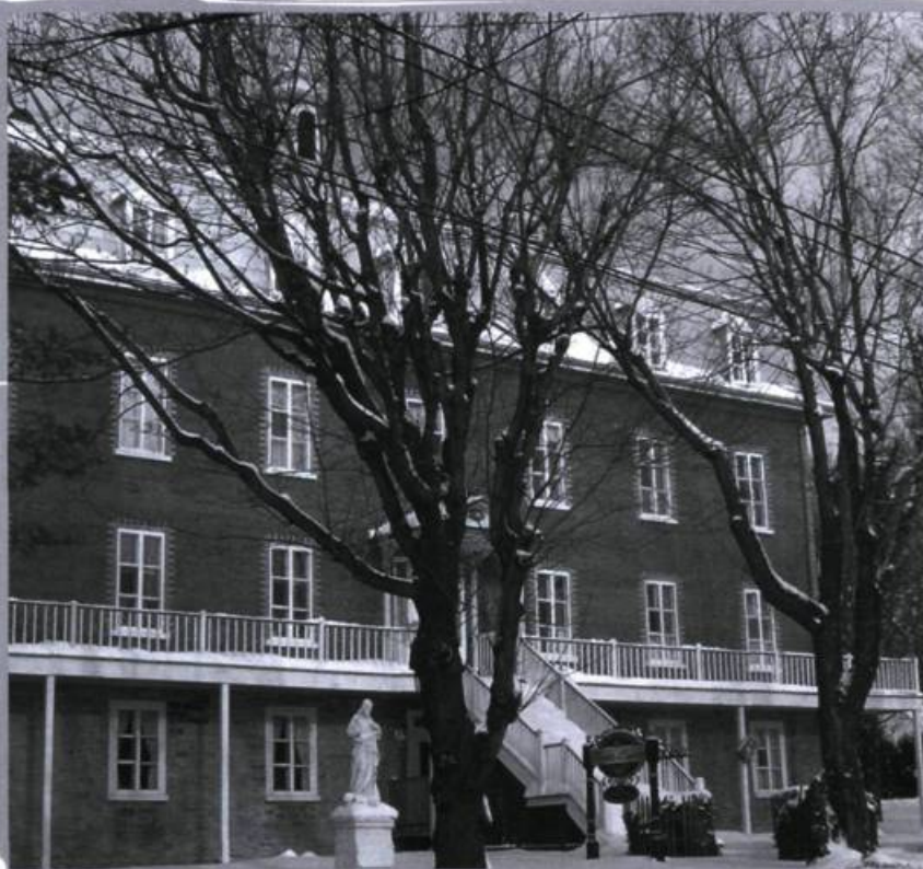
La façade du couvent des sœurs du Bon-Pasteur à Charlesbourg construit en 1883.

Outre les jeux et la vente de pièces d'artisanat qui assurent les revenus de l'activité, les religieuses tiennent, dans une salle attenante au bazar, un comptoir où l'on sert des rafraîchissements, y compris de la bière. Elles confient le service des boissons à des dames très dignes qui agissent bénévolement comme « barmaids ». Cette activité représente une source importante de revenus du bazar.