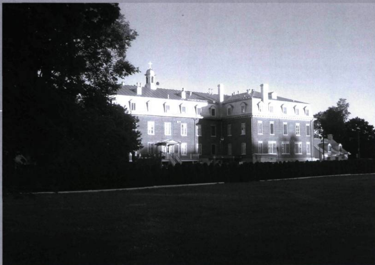
Le couvent des sœurs du Bon-Pasteur (1883) vu de l'arrière avec l'annexe de 1911.

Finalement, le 15 janvier 1886, tous s'accordent pour régler le différend hors cour. La municipalité accepte un paiement de 50 $ de la part de Boivin tandis que le conseil et la communauté des religieuses s'acquittent du reste. Dura lex, sed lex!