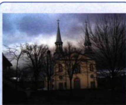
Église Saint-Charles-Borromée de Charlesbourg.

« Dans ces "temps anciens", les paroisses au nord de la ville de Québec n'étaient pas nombreuses; la paroisse de Charlesbourg était bornée au sud par la paroisse St-Roch de Québec, à l'est par la paroisse de Beauport et à l'ouest par la Paroisse de l'Ancienne-Lorette. Au nord, la paroisse de Charlesbourg s'étendait jusqu'à l'arrière pays... du Saguenay (...) les débuts de Charlesbourg remontent à 1660. » 2 .