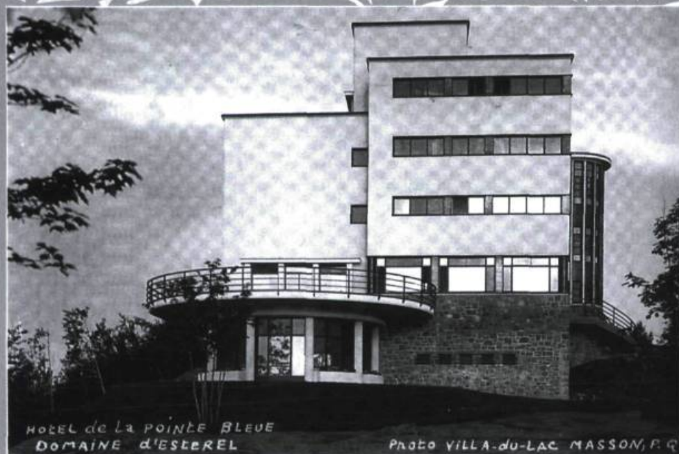
HÔTEL DE LA POINTE BLEUE DOMAINE D'ESTÉREL

Cette richesse non renouvelable appartient pour l'instant au domaine public, mais pour combien de temps encore?