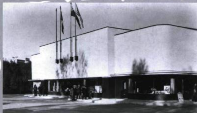
Bâtiment commercial de l'Estérel, Lac Masson.