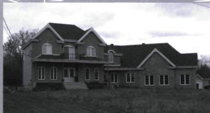
Demeure dite moderne, dans les Laurentides.