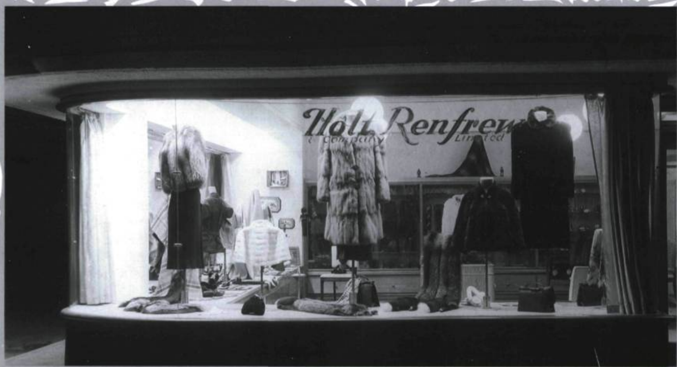
Boutique Holt Renfrew, bâtiment commercial de l'Estérel, Lac Masson.

« Le très réputé "Holt Renfrew" compte parmi les magasins du bâtiment. La boutique partage le premier étage avec l'atelier de réparation de voitures, la station-service, le restaurant-bar "Blue Grill" (où est situé le restaurant actuel), appartenant au chalet de ski voisin, un marché, une pâtisserie (dirigée par le Belge M. Mignolet), une tabagie, un poste de taxi, un coiffeur, la boutique de ski, etc. Les bureaux de la compagnie, les dortoirs du personnel ainsi que le cinéma (ou salle de spectacle) se trouvaient au deuxième étage, qui est maintenant occupé par l'hôtel de ville. Le cinéma pouvait accueillir environ 300 personnes qui, par la suite, s'installaient confortablement dans ses fauteuils en cuir vert.