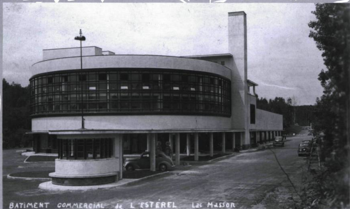
BÂTIMENT COMMERCIAL DE L'ESTÉREL Lac MASSON

Bâtiment commercial de l'Estérel : Community Centre, Lac Masson.