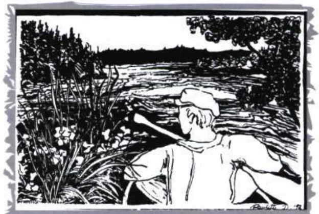
Illustration de Paulette Dupuis. (Source : Chroniques de l'arrière-pays [ensemble multi-support] : Sainte-Anne-du-Lac en SOIXANTE-QUINZE ANS, Éditions de la Parole vivante, 1992)