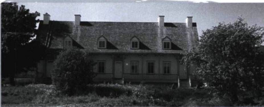
Bâtiment principal de la Grande Ferme à Saint-Joachim.

Dans les faits, l'histoire de notre territoire est étroitement liée à la fondation de la ville de Québec car, depuis le début de la colonie, notre région se présente comme son complément naturel. Quatre ans après le premier établissement en Acadie, c'est la Côte-de-Beaupré et la ville de Québec qui ont donné réellement vie à l'implantation française permanente en Amérique. Il faut préciser qu'il s'agit bien de l'implantation française, car cette terre était déjà habitée par les Iroquoiens qui appréciaient les embouchures des nombreux cours