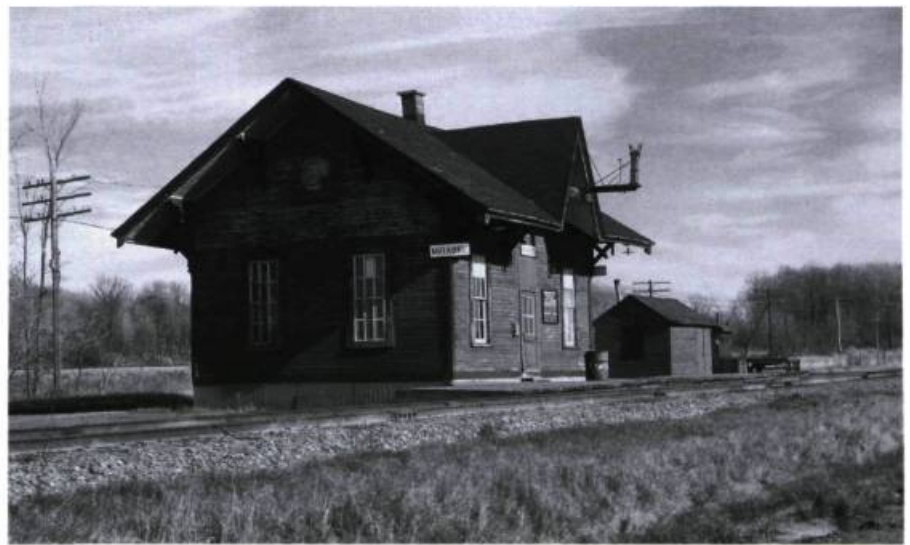
À mi-chemin entre l'église et le manoir, il y avait la gare, aujourd'hui disparue.

Si Jos Fortier l'emportait avec ses volailles, les Trappistes d'Oka raffaient presque tous les honneurs réservés... aux vaches et aux chevaux. Évidemment, ce Jos Fortier était un notable bien en vue de Sainte-Scholastique. Il y avait aussi ceux qui venaient pour les courses de chevaux... Mais ce qu'on voyait surtout dans les journaux, le lendemain, c'était la photo du député caressant voluptueusement la croupe d'une belle grosse Holstein.