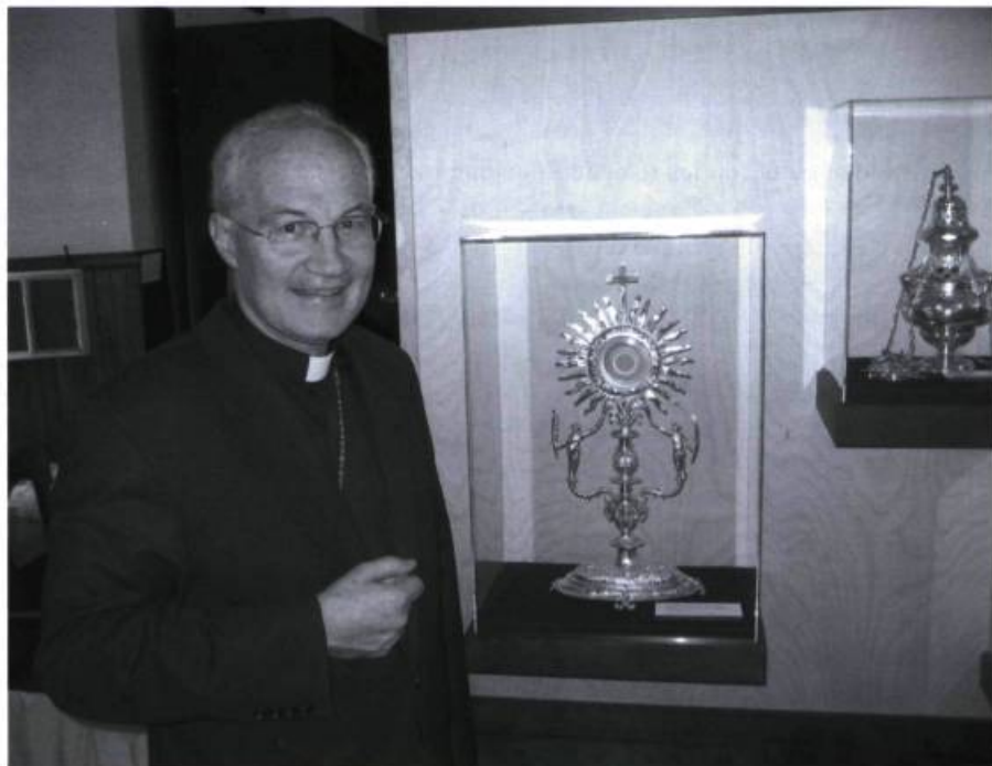
Monseigneur Marc Ouellet lors de l'inauguration de l'exposition paroissiale en mai 2004, près de l'ostensor sous verre.

Au printemps suivant, en 2003, on décida de présenter cet ostensor à l'exposition de l'été, sans le restaurer, faute de fonds. Cette fois, c'est sur un tissu