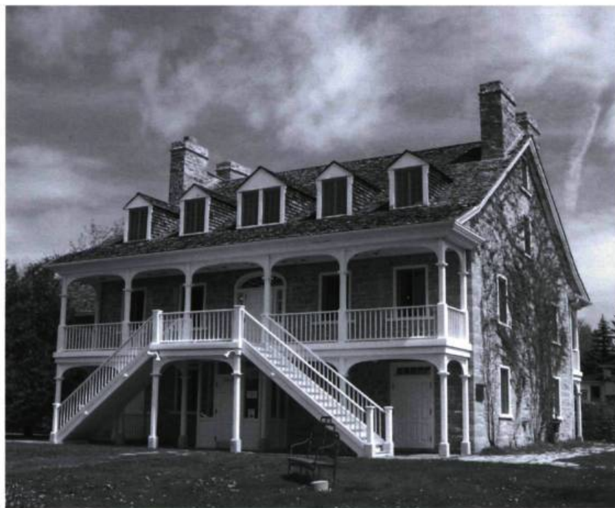
L'auberge Symmes à Aylmer, telle qu'on peut la voir aujourd'hui.