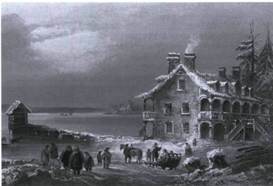
Illustration de l'auberge Symmes, Aylmer (Gatineau), 1842, par William H. Bartlett, dans Canadian Scenery.