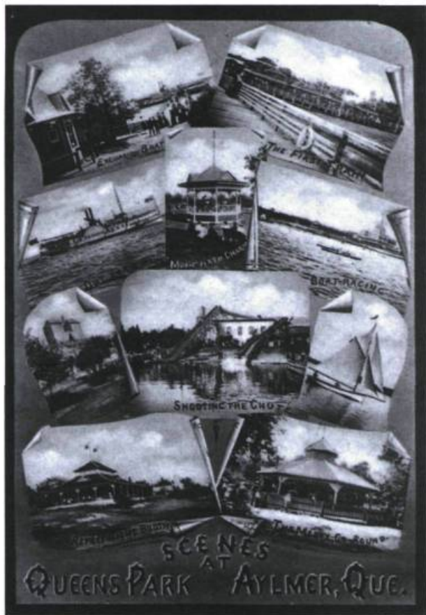
Queen's Park, Aylmer. Carte postale, Musée de l'Auberge Symmes, Gatineau.

acres qui attirait des gens de partout en Amérique du Nord. Malheureusement, l'incendie qui rasa en 1915 le célèbre hôtel Victoria, à proximité de la marina et de Queen's Park (le parc d'attraction), et la fermeture définitive du parc d'amusement à la fin des années 1920 allaient marquer le glas d'Aylmer comme centre majeur.