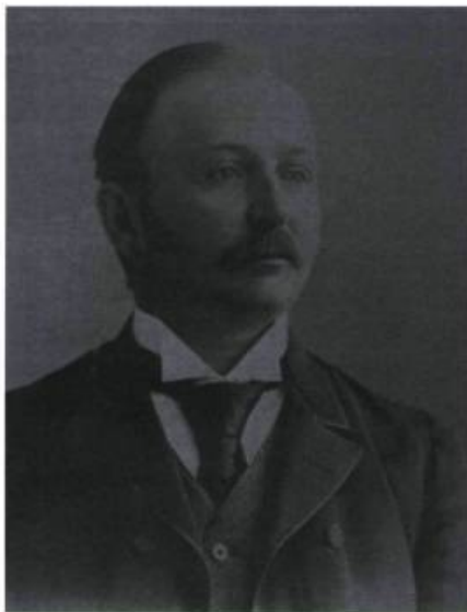
Simon-Napoléon Parent (1855-1920) 12 e premier ministre du Québec et 21 e maire de Québec.

En 1890, il est élu échevin du quartier Saint-Vallier à Québec et député libéral de Saint-Sauveur à l'Assemblée législative. Parent s'impose par ses tendances populistes, son sens de l'organisation, ses qualités