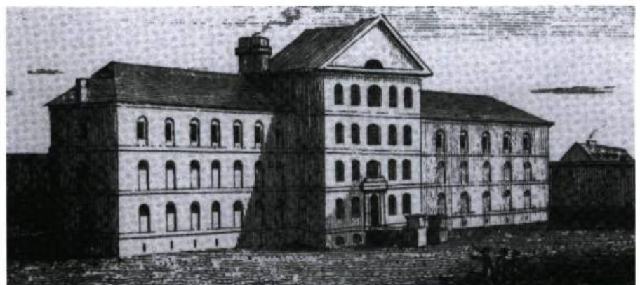
La nouvelle prison de Au pied-du-Courant (ANQ)

Arriverait bientôt le rapport Durham, suivi de l'Acte d'Union et de toutes ses conséquences pour les Canadiens français...■