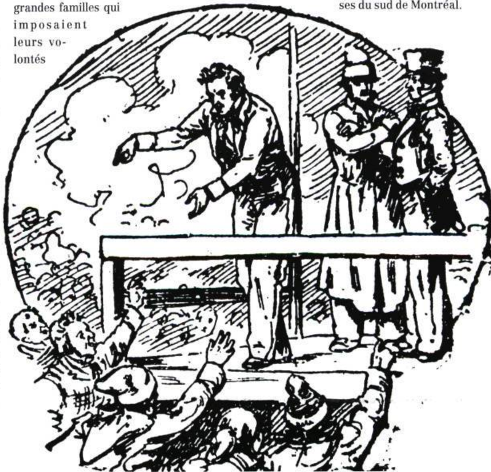
Wolfred Nelson à l'Assemblée des Six-Comtés par Henri Julien.

Mais il n'y eut pas que dans Deux-Montagnes que les hommes de Colborne le sanguinaire, surnommé «le vieux brûlot» et aussi connu comme «le boucher», répandirent la terreur, le feu et la mort. Sans que les Patriotes n'aient attaqué personne ou qu'ils n'aient causé des dommages irréparables aux biens d'autrui, le représentant de la reine Victoria et ses officiers se déchaînèrent aussi contre deux villages de la vallée du Richelieu et quelques autres paroisses du sud de Montréal.