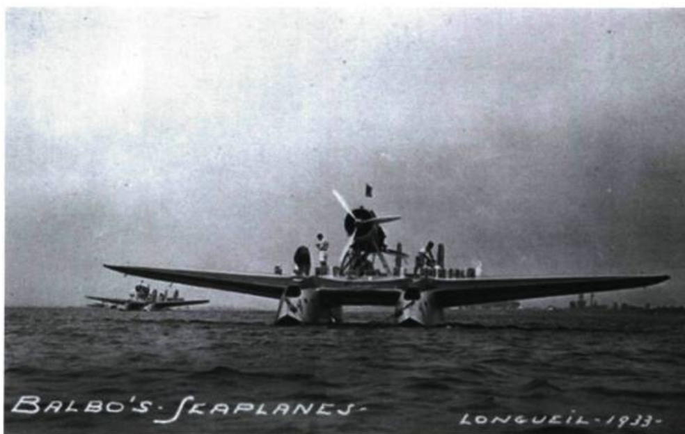
Arrivée d'Italo Balbo à Longueuil.

Italo Balbo lui répond : «Je vous remercie, ainsi que la population de la province de Québec, du fraternel intérêt que vous portez aux exploits des ailes italiennes.»