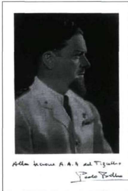
Photographie autographiée d'Italo Balbo.

Son second voyage est spectaculaire, plus que la première traversée. Sur le plan de l'aviation, il n'apporte aucune nouveauté. Mais c'est l'équipage de 24 avions (25 au départ) et d'une centaine d'hommes qui fait la différence. L'importance de Balbo au sein du gouvernement, où certains le voyaient comme le dauphin de Mussolini, rend la signification du voyage politiquement plus intéressante. De