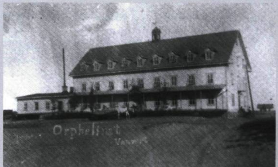
Illustration 1. L'orphelinat de Vauvert, fondé en 1907. Il renfermait le bureau de poste.)