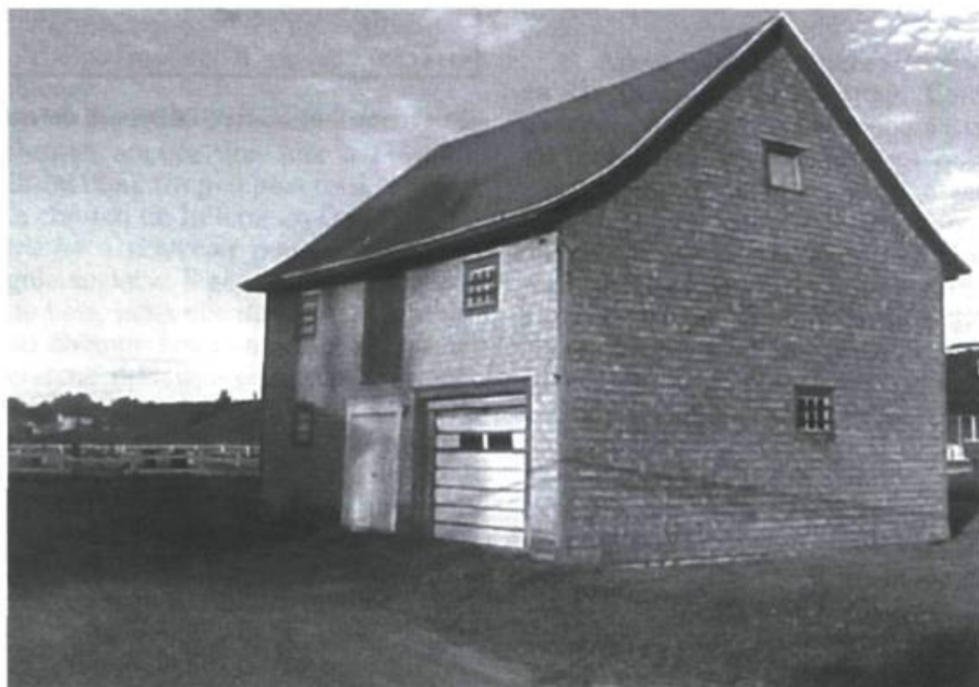
La grange à dîme

(Archives de l'Archidiocèse de Rimouski, Sainte-Flavie, Rapports annuels 1868.)