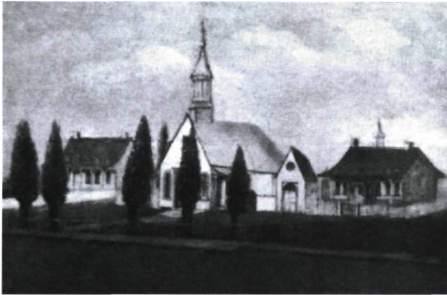
La première église Saint-Joseph de Soulanges (dessin reproduit dans le volume l'Histoire des Cèdres de l'abbé Auclair, édité en 1927). Vers 1752, à partir de là, un prêtre résident desservait environ 80% du territoire aujourd'hui couvert par le diocèse de Valleyfield. Son emplacement se trouvait sur le domaine seigneurial, à mi-chemin entre le village actuel des Cèdres et celui des Cascades.

dans celle de Soulanges. À la mort du premier Vaudreuil, survenue en 1725, les droits et devoirs seigneuriaux échurent à l'un de ses fils, Pierre-François de Rigaud de Vaudreuil. En 1732, ce dernier obtint pour lui-même et son frère Pierre de Rigaud de Vaudreuil de Cavagnal, qui sera le dernier gouverneur-général de la Nouvelle-France, une seigneurie prolongeant celle de Vaudreuil le long de l'Outaouais, qui se nommera Rigaud et qui englobait le territoire des actuelles municipalités de Rigaud, Pointe-Fortune, Très-Saint-Rédempteur et Sainte-Marthe. En 1763, les de Vaudreuil étant retournés en France, la succession seigneuriale voit s'installer la dynastie des Chartier de Lotbinière. Il y eut tout d'abord le marquis Michel-Gaspard Chartier de Lotbinière, celui qui a donné le premier véritable essor à la seigneurie de Vaudreuil; en 1773, son fils Michel-Eustache-Gaspard-Alain lui succède jusqu'en 1829 puis la fille de ce dernier, Louise-Josephite Chartier de Lotbinière et son époux Robert Unwin Harwood héritèrent de Vaudreuil, tandis que sa sœur Marie-Charlotte et son époux William Bingham héritèrent de celle de Rigaud.