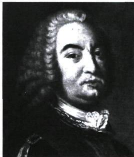
Le marquis Pierre Rigaud de Vaudreuil Cavagnal (1698-1778), deuxième seigneur de Vaudreuil et de Rigaud.

tion du système seigneurial figurait en bonne place dans la liste des réquisitions. Il survécut cependant jusqu'en 1854. Ce régime avait été le reflet de la structure sociale fortement hiérarchisée de la métropole française. Les riches seigneurs, à quelques exceptions près, se prenaient un peu pour des petits rois et se sont souvent mérité le mépris de leurs pauvres censitaires auxquels ils se mêlaient bien peu. L'histoire locale ne retient d'eux que leurs