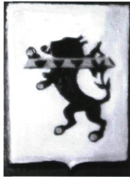
Les armoiries de la famille Saveuse de Beaujeu.