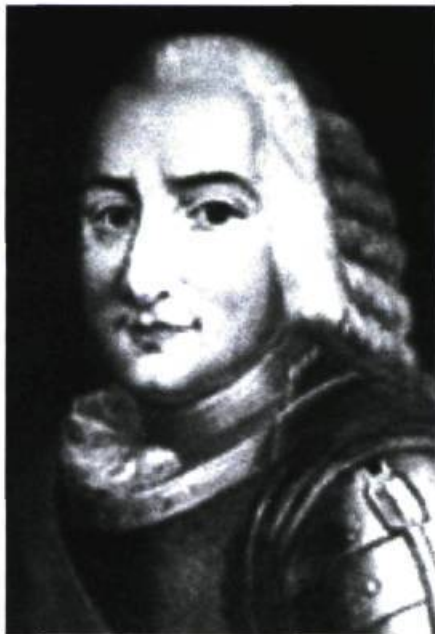
Le marquis Philippe Rigaud de Vaudreuil (1643-1725), premier seigneur de la seigneurie qui portait son nom.

P hilippe de Rigaud marquis de Vaudreuil, issu d'une famille de vieille noblesse du Languedoc, vint en Nouvelle-France en 1687. Comme beaucoup le faisaient à l'époque, il visait l'avancement de sa carrière pour redorer son blason; un moyen d'y parvenir, consistait à faire fortune dans le