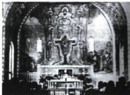
L'œuvre finale composant la Sainte Trinité

tandis que le croquis dont il est question plus haut représenterait un premier essai. Ozias Leduc s'est inspiré de la mosaïque de Lisieux Dieu est chanté pour mener à bien son œuvre. Il a toutefois quelque peu modifié le thème pour le concevoir avec une plus grande émotivité.