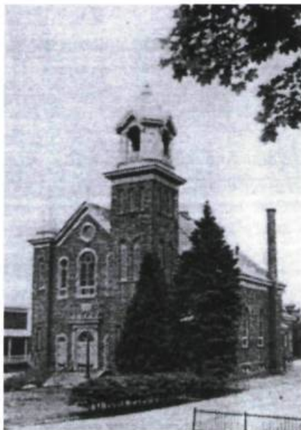
L'église Notre-Dame-de-la-Présentation d'Almaville-en-Bas

rait répondre à leurs aspirations. La construction d'un nouveau temple débuta donc en mars 1924.