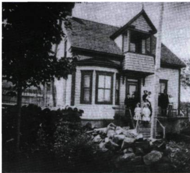
C'est dans cette demeure qu'était dispensé le service postal d'Almaville-en-Bas. Les plis dont il est question dans ce texte ont tous transité par ce bureau.

Vers la fin de l'année 1944, Ozias Leduc devait encore habiter Almaville car une lettre provenant de l'Académie Royale Canadienne des Arts, de Montréal lui fut adressée à Saint-Hilaire. Elle transita vers le bureau de poste d'OTTERBURN PARK avant d'atteindre ST.HILAIRE STATION. De là, la lettre fut dirigée vers ALMAVILLE-EN-BAS après avoir reçu la mention «MIS-SENT TO». Le cachet particulier de cette enveloppe réside dans le fait qu'elle origine de l'A.R.C.A. Les armoiries dans le coin supérieur gauche ne sont pas sans nous appeler deux événements importants qui sont survenus au cours de la carrière de Leduc. En 1907, il est proposé comme candidat à l'Académie mais les membres refusent sa candidature. Toutefois, dix ans