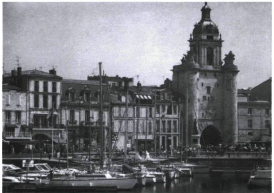
Le port de La Rochelle et la porte de la Grosse Horloge.

Et dans les vieilles rues de La Rochelle, quelle n'avait pas été notre surprise de voir flotter au vent quelques drapeaux du Québec. Nous avons l'impression d'arriver dans un pays que nous n'avions jamais quitté. C'était en mai 1989. Déjà.