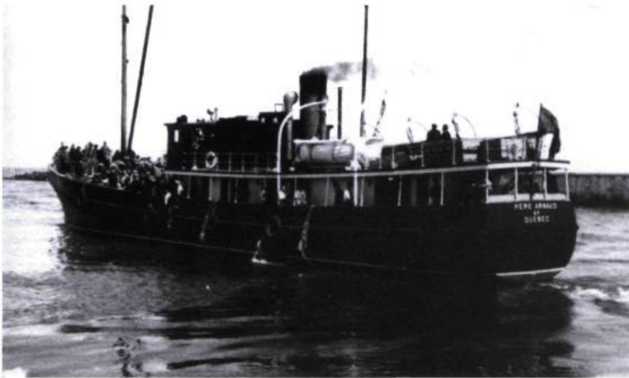
Le Père Arnaud , navire de la Compagnie de Transport du Bas-Saint-Laurent, pèrit dans le golfe du Mexique au milieu des années 1940.

un qui, un jour, s'engagea comme mousse à l'âge de quatorze ans sur un voilier anglais comme le fit mon grand-père en 1874.