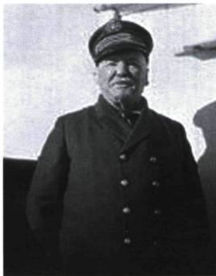
Le capitaine Joseph-Elzéar Bernier, né à L'Islet en 1852.

Le commerce du bois fut semble-t-il la seule justification à la construction du grand quai, il garda jusqu'à la fin cette vocation. Déjà au milieu du XIX e siècle, le capitaine Thomas Bernier (père de l'explorateur) s'était allié à la maison Stearn pour le transport du bois de Powell vers les ports de la mer d'Irlande. Il possédait son propre chantier de construction de navires à l'endroit où se trouvent aujourd'hui les