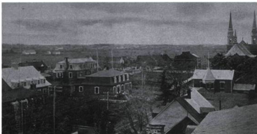
Le village de l'Islet. (Carte postale Pruneau et Kirouac, Québec – Bibliothèque nationale du Québec)

Dans les années qui suivirent la conquête, la situation évolua. La révolution américaine avait contraint ceux qui étaient demeurés fidèles à la couronne britannique à émigrer au Canada. Ils arrivaient donc ici, plus fortunés que les Canadiens ruinés par la conquête. Chez nous, ils purent se