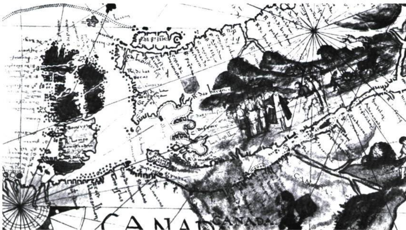
Carte du deuxième voyage de Jacques Cartier. (British Museum)