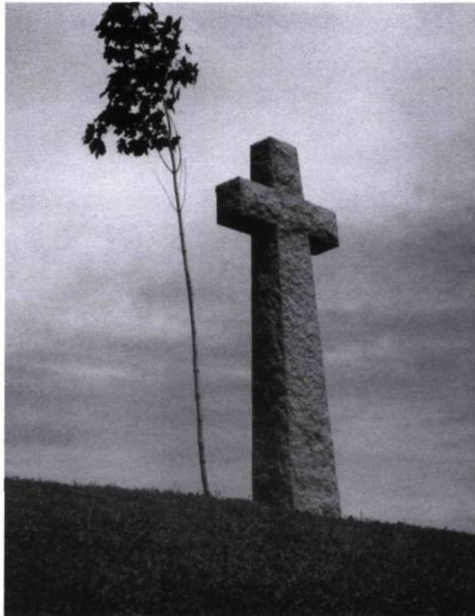
Croix commémorant l'arrivée de Cartier en Nouvelle-France.

Cartier ne passera qu'une journée à Hochelaga. En redescendant le fleuve, il ajoutera à la toponymie naissante des lieux. La rivière Saint-François reçut le nom de Montmorency et Chateaubriand fut le nom