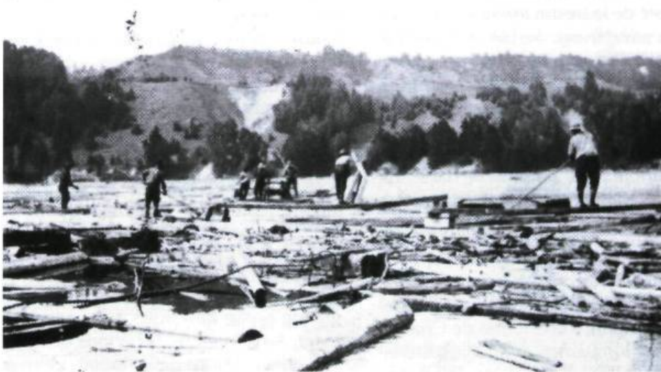
La forêt : la drave sur la rivière Malbaie.

Mais, malgré tout le pittoresque de cette tradition navale, la région de Charlevoix demeura très isolée jusque vers 1850 particulièrement. À partir de ce moment, des estivants se rendirent en grand nombre dans la région à bord d'imposants bateaux de croisière à vapeur. Ces bateaux furent opérés par la Richelieu Co. et plus tard par la Canada Steamship's Line. Leur existence assura à la région une réputation enviable comme site de villégiature et de tourisme. Ces bateaux blancs, comme les surnommèrent les gens de la région, ont navigué durant plus de 100 ans sur les bords de Charlevoix à chaque été. C'était au temps de la belle époque des croisières qui se rendaient vers le Saguenay et où des touristes huppés pouvaient s'arrêter pour séjourner dans des hôtels de grande classe comme le Manoir Richelieu et l'Hôtel Tadoussac et goûter ainsi à loisir les splendeurs du paysage charlevoisien. Malheureusement, ces bateaux de croisière dis-