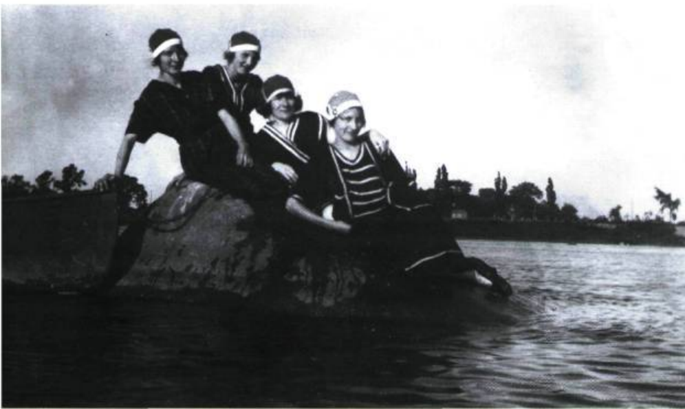
Les baigneuses. Photographie prise à Boucherville dans les années 1920.

Évidemment, c'est bien beau de pouvoir se rendre dans la belle campagne de Boucherville; cependant, il faut avoir le temps et l'argent pour se le permettre. Mais qui peut bien en avoir les moyens? En cette fin de siècle, en pleine période d'industrialisation, les hommes travaillent en général