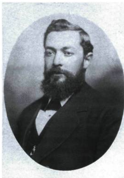
Charles Desmarteau.

Charles Desmarteau peut être considéré comme le pionnier des villégiateurs à Boucherville. Né à Boucherville en 1839, Charles Desmarteau acquiert très tôt un établissement commercial à Montréal et devient rapidement prospère. Ses services à titre de comptable sont utilisés par des compagnies et des particuliers. Il se taille une forte réputation professionnelle et développe des contacts avec les dirigeants de la société montréalaise de l'époque. Il est élu conseiller pour le district Sainte-Marie en 1869 et est