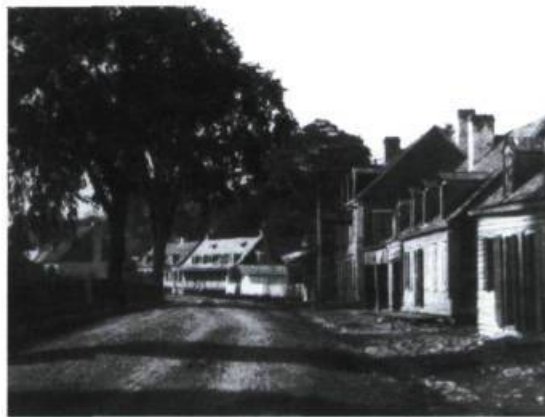
Le village des tanneries en 1865.

Que savons-nous donc au juste de ce scandale? Dans son Histoire de la province de Québec , l'historien Robert Rumilly évoque en ces termes le scandale des tanneries: