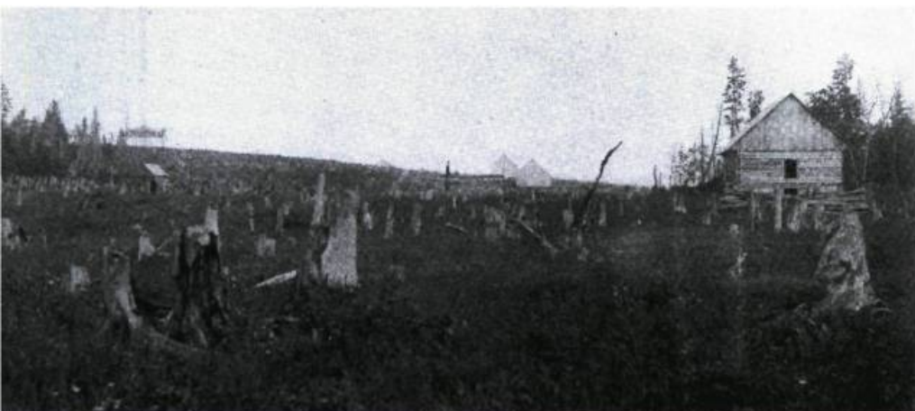
La colonie de Sainte-Apolline-de-Patton avant 1900.

Cette paroisse, détachée de Saint-Pamphile, fut connue de 1911 à 1956 comme la municipalité des Cantons unis de Casgrain-et-Leverrier. Elle devint Saint-Adalbert en