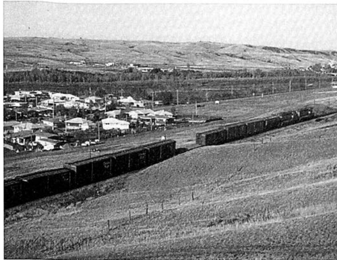
La voie ferrée du C.P.R. traversant les prairies.

disposer de celles de l'État. Quoi qu'il en soit, on reconnut bien vite l'excellente qualité de cette terre de céréales et entre 1902 et 1907 seulement la compagnie en vendit environ sept millions d'acres, toutes bien situées de part et d'autre de la voie ferrée, dans un couloir de 80 kilomètres de large.