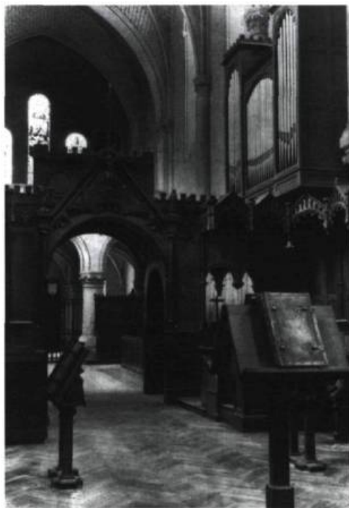
Vue intérieure de l'église abbatiale de Bellefontaine

Peu à peu, sous l'impulsion d'un supérieur de grand talent, Dom Michel Le Port, la restauration se poursuivit lentement et dans une grande pauvreté. Dom Michel fut d'abord élu prieur claustral, Dom Augustin de Lestrangle étant alors supérieur jusqu'à sa