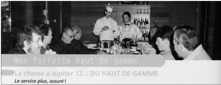
Publicité pour un forfait de chasse au cerf, Sépaq-Anticosti, 2002.

easy to imagine ourselves a part of that bygone gilded era 40 . » Les menus des pourvoiries, dont on mentionnera le luxe ou du moins l'abondance en produits non locaux, pourraient être lus aussi comme un affichage ostentatoire de la civilisation des hôtes de la forêt (illustration 2).