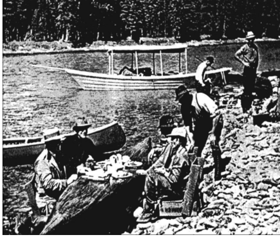
«Lunch is served!», E. Wilson, Anticosti Island... , loc. cit., 128.