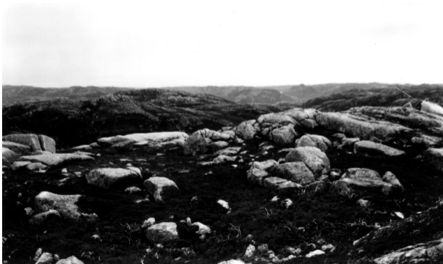
FIGURE 4. Sommets de collines dénudés de la partie est du plateau Big Level, avec tundra à éricacées et lichens.

Western, gently undulating part of the Big Level Plateau, showing a large felsenmeer; the valley walls comprise numerous solifluxion lobes; small snowbeds are sometimes encountered at the base of the lobes.