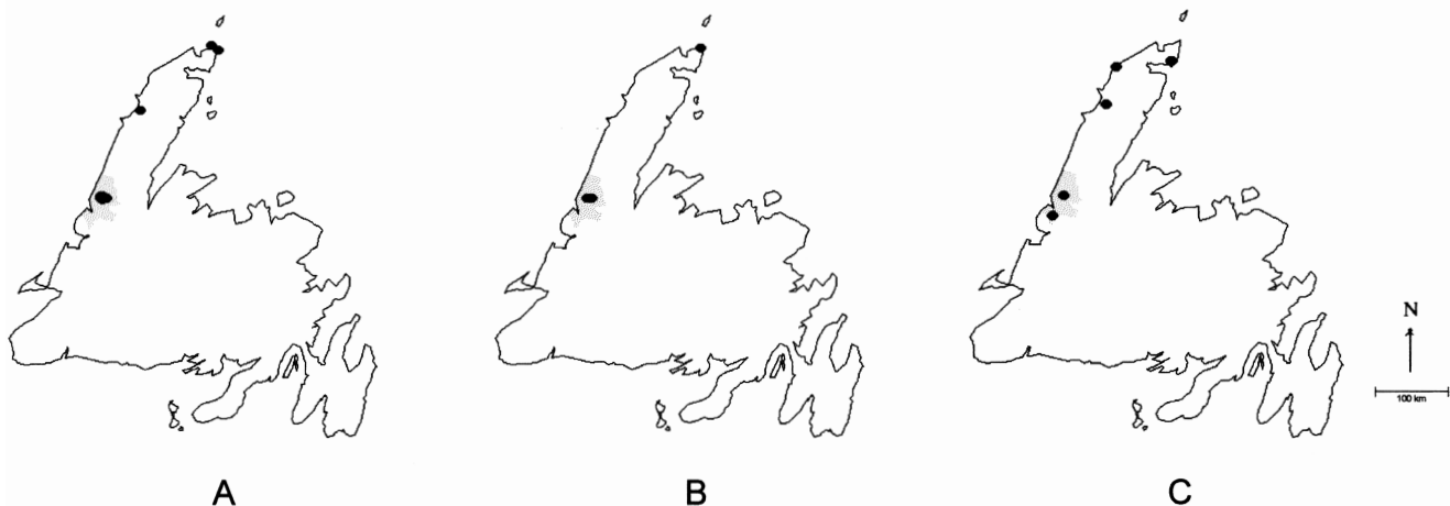
FIGURE 10. Carte de l'aire de trois espèces alpines à Terre-Neuve qui atteignent leur limite sud dans l'île au parc national du Gros-Morne (localisation à la fig. 1). A. Carex lachenalii . B. Salix argyrocarpa . C. Veronica wormskjoldii .

Sur le plateau Big Level, les 21 espèces de plantes vasculaires rares se trouvent dans les combes à neige et dans les communautés alpines associées. Les espèces suivantes croissent seulement dans les combes à neige : Athyrium alpestre , Carex lachenalii , Epilobium anagallidifolium , E. lactiflorum , Gnaphalium norvegicum , G. supinum , Huperzia miyoshiana , Oxyria digyna , Salix herbacea , S. argyrocarpa , Saxifraga foliolosa , Sibbaldia procumbens , Vahlodea atropur-