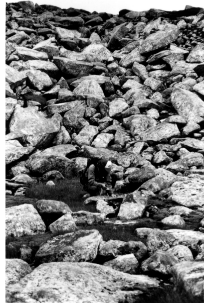
FIGURE 7. Petite combe à neige à la base d'un lobe de solifluxion (voir fig. 2) ; la neige de cette combe fond plus tôt que celle de la figure 6.

Late melting snowbed (photographed in late August), more or less amphitheater-shaped, on the flank of a hill overlooking a small lake; krummholtz are only found in well-protected areas on the plateau, such as the margins of lakes.