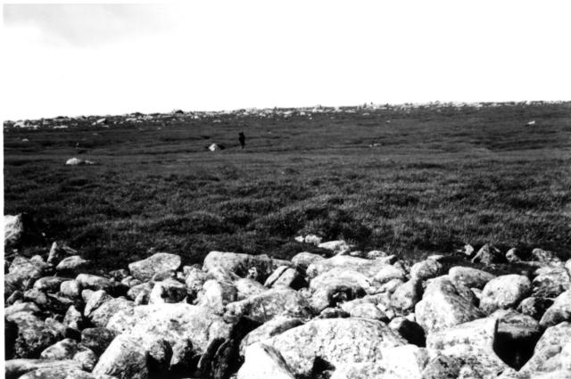
FIGURE 5. Pente douce de la partie est du plateau Big Level avec, de l'avant à l'arrière, un felsenneer, une bande de lande à buttes et un fen structuré (avec personnages debout) ; le sommet est couvert d'une lande à buttes avec de petits blocs erratiques dispersés partout.

Dans les sites d'échantillonnage du plateau Big Level (93-3, 93-9, P-139), 36 espèces de plantes vasculaires ont été recensées, soit 39% de la biodiversité totale des habitats étudiés. Une seule espèce rare s'y trouve, Diphasiastrum