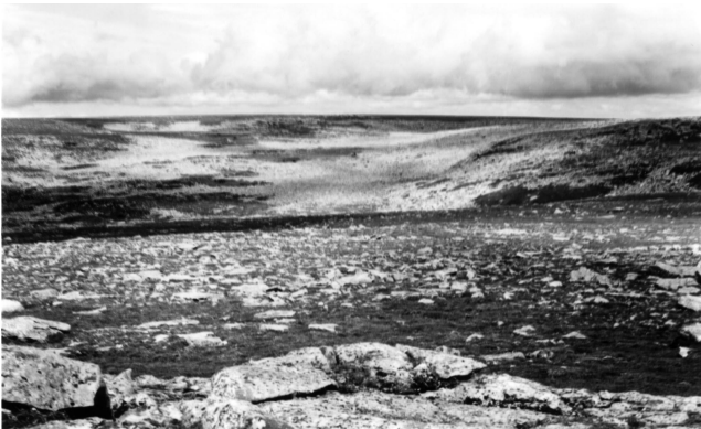
FIGURE 3. Partie occidentale, ondulée du plateau Big Level, montrant un vaste felsenmeer dans une vallée dont les parois comportent de nombreux lobes de solifluxion ; de petites combes à neige se trouvent parfois à la base des lobes.

Big Level Plateau as seen from the coastal plain, Gros Morne National Park; the entrance to the fjord Western Brook Pond is visible on the left.