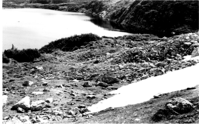
FIGURE 6. Combe à neige à déneigement tardif du plateau Big Level (photographie prise à la fin août), plus ou moins en forme d'amphithéâtre, sur le flanc d'une colline plongeant vers un lac ; les krummholtz ne se trouvent que dans les zones bien protégées du plateau, comme au bord des lacs encaissés.

Dans les stations échantillonnées sur le plateau Big Level (combes à déneigement hâtif, 93-10 ; combes, 93-1, 93-2, 93-5, 93-6 [les deux dernières correspondant à la station R3 de Belland et Roberts, 1984], 93-7, 93-11, 93-13, 93-14, 84-30, P-137, P-138, P-142 ; 84-29 sur le plateau de St. Paul's Inlet, 84-31 sur les collines de Rocky Harbour), 73 espèces de plantes vasculaires ont été inventoriées, représentant 79 % de la biodiversité de tous les habitats étudiés au Big Level, et 21 espèces rares y sont rencontrées (dont 20 sont confinées aux combes à neige). Les espèces caractéristiques des combes à neige sont Agrostis mertensii , Athyrium alpestre , Carex