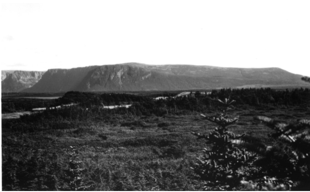
FIGURE 2. Le plateau Big Level vu depuis la plaine côtière, parc national du Gros-Morne ; l'entrée du fjord Western Brook Pond est visible à gauche.

Big Level Plateau as seen from the coastal plain, Gros Morne National Park; the entrance to the fjord Western Brook Pond is visible on the left.