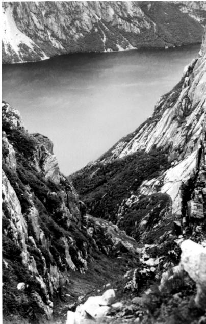
FIGURE 9. Ravin de la paroi nord du plateau Big Level, donnant dans le fjord Western Brook Pond, avec parois abruptes et des espèces croissant dans des combes à fonte hâtive.

A large snowbed on the gentle slope of an alpine brook valley, habitat of Veronica wormskjoldii ; snowmelt here is earlier than in Figures 6 and 7.