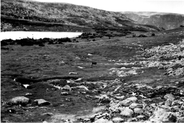
FIGURE 8. Grande combe à neige sur pente douce de la vallée d'un ruisseau alpin, habitat de Veronica wormskjoldii ; la fonte est plus hâtive ici que dans les combes des figures 6 et 7.

A large snowbed on the gentle slope of an alpine brook valley, habitat of Veronica wormskjoldii ; snowmelt here is earlier than in Figures 6 and 7.