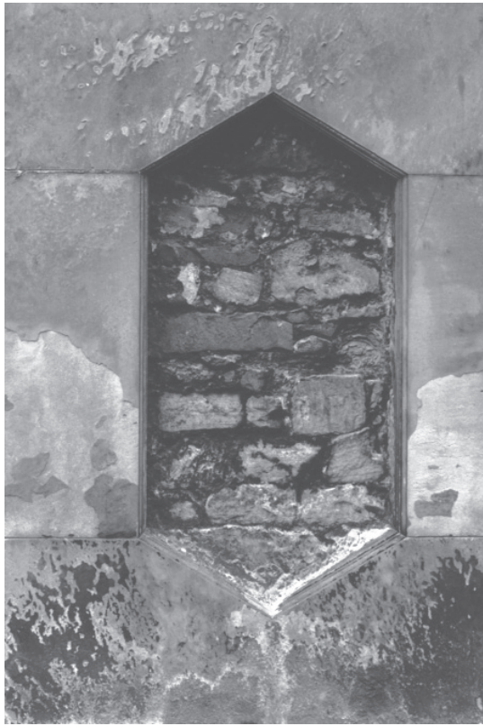
André Clément, Double percée

neutre et objective. Ils accumulent alors les observations jugées pertinentes, ils en discutent en équipe, puis ils envisagent d'entreprendre une démarche auprès du médecin.